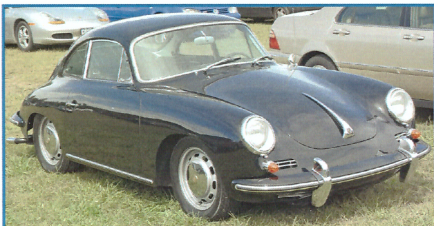
PORSCHE 356 BT5 S90 MONO GRIGLIA