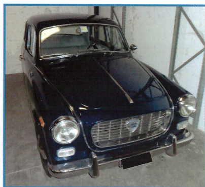
LANCIA APPIA 1966 1200 cc