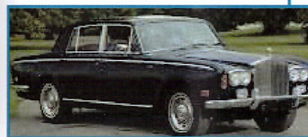
ROLL ROYCE SILVER SHADOW 1976 2700 cc