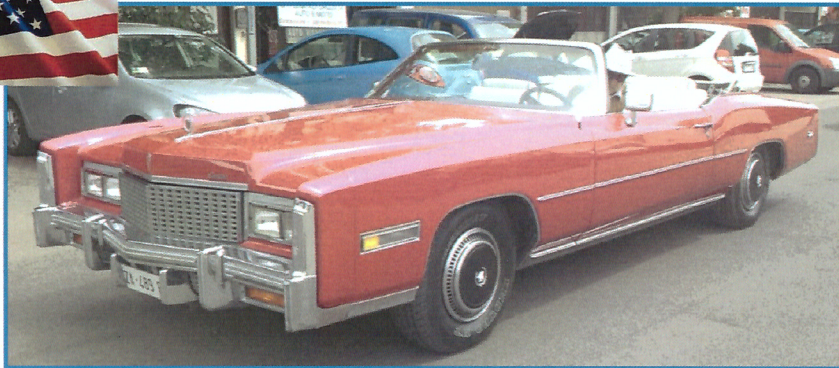
CADILAC ELDORADO 1976 8000 CC Impianto GPL