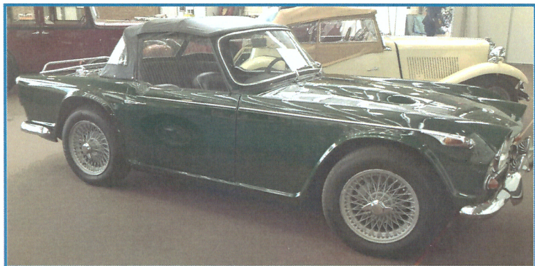
TRIUMPH TR4 IRS ANNO 1965 2000 cc 4 CILINDRI