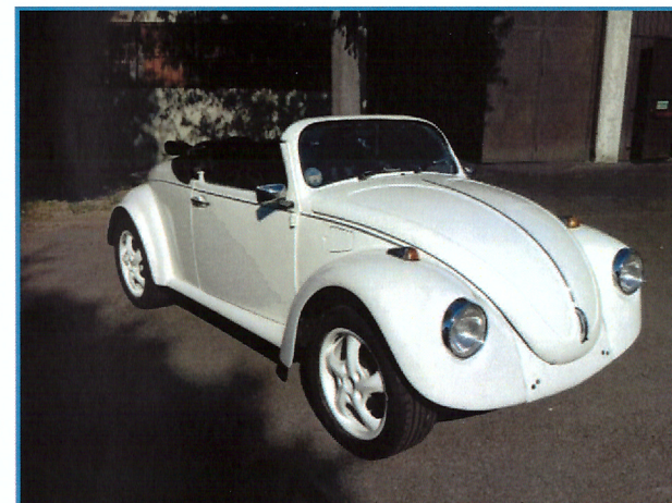
VOLKSWAGEN MAGGIOLINO SPEED STER 1300 cc