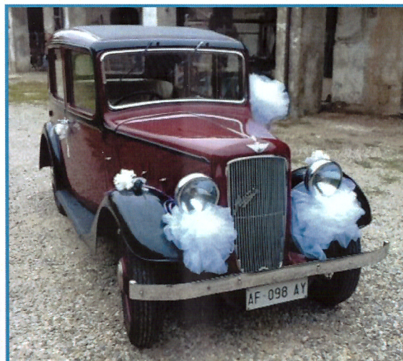
AUSTIN TEN 1930 1000 cc