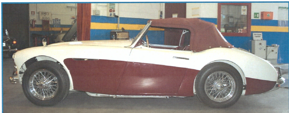
AUSTIN HEALY 100/6 ANNO 1958 TARGA ORO A.S.I.