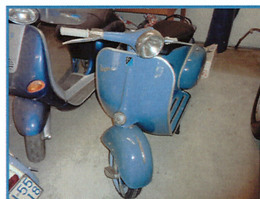
VESPA VBB1 1961 125 cc