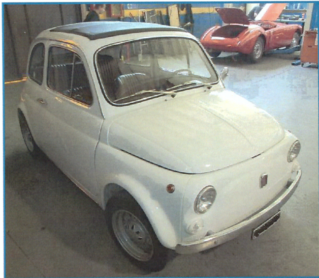
FIAT 500 L 1968 500 cc