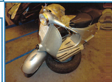
VESPA 150 GV VS1 1955