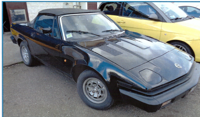
TRIUMPH TR7 ANNO 1982 2000 cc