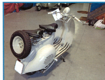
VESPA STRUZZO I° SERIE 1954