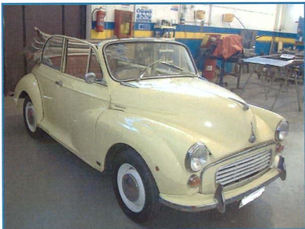
MORRIS MINOR 1977 1000 cc CC 1000