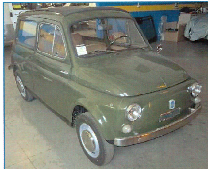
FIAT 500 GIARDINIERA 1972 500 cc