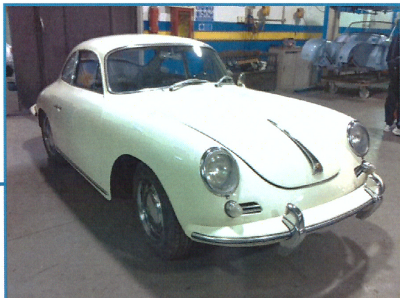
PORSCHE 356 C 1963 1600 cc 75 cv