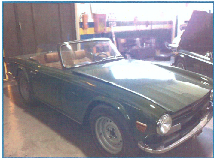
TRIUMPH TR6 ANNO 1973 2500 cc