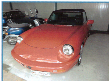
ALFA ROMEO SPIDER 1992 1600 cc