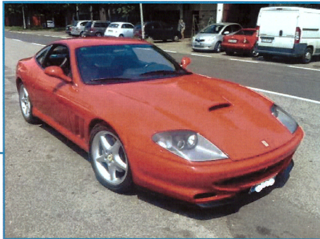
FERRARI 550 MARANELLO 1998 5500 cc