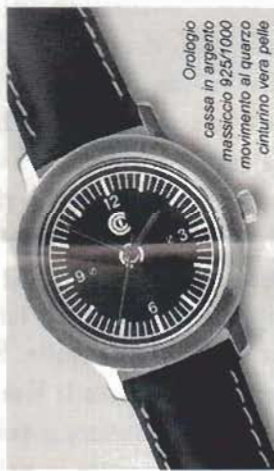
Orologio cassa in argento massiccio 925/1000 movimento al quarzo cinturino vera pelle