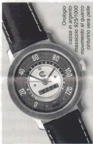
Orologio cassa in argento massiccio 925/1000 movimento al quarzo cinturino vera pelle