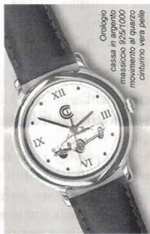
Orologio cassa in argento massiccio 925/1000 movimento al quarzo cinturino vera pelle

Orologi in esaurimento. Restano pochi esemplari delle varie serie di orologi in argento.